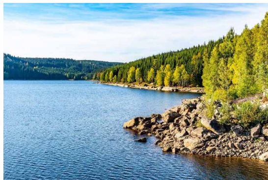
Obrázek 1: Josefův důl, dostupné z: https://www.tuzemska-dovolena.cz/obec-josefuv-dul/

Převzetí psa: ráno na adrese majitele možnost vzít pejska už den předem odpoledne za stejnou cenu