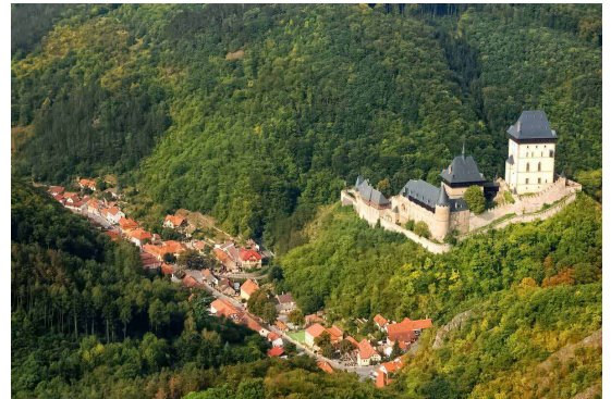
Obrázek 1: Hrad Karlštejn, dostupné z: https://www.amazingczechia.com/destinations/karlstejn/